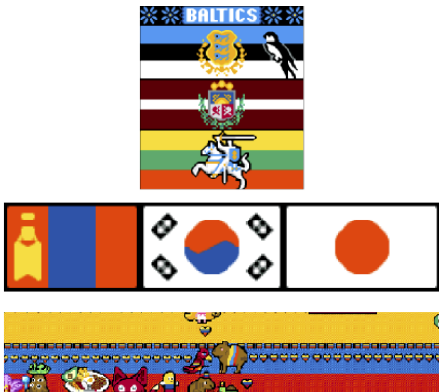
Figura 3. Muestras de las representaciones nacionalistas en la Europa del Este (Estonia, Letonia y Lituania), Asia (Mongolia, Corea del Sur y Japón) y América Latina (Colombia).