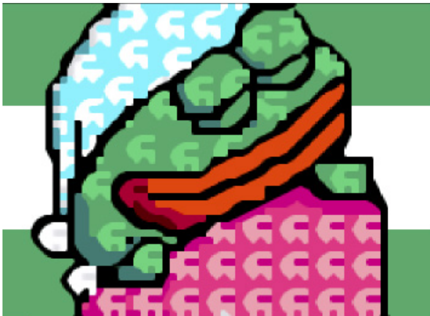
Figura 4. Muestra del meme de Pepe la Rana con la bandera andaluza de fondo