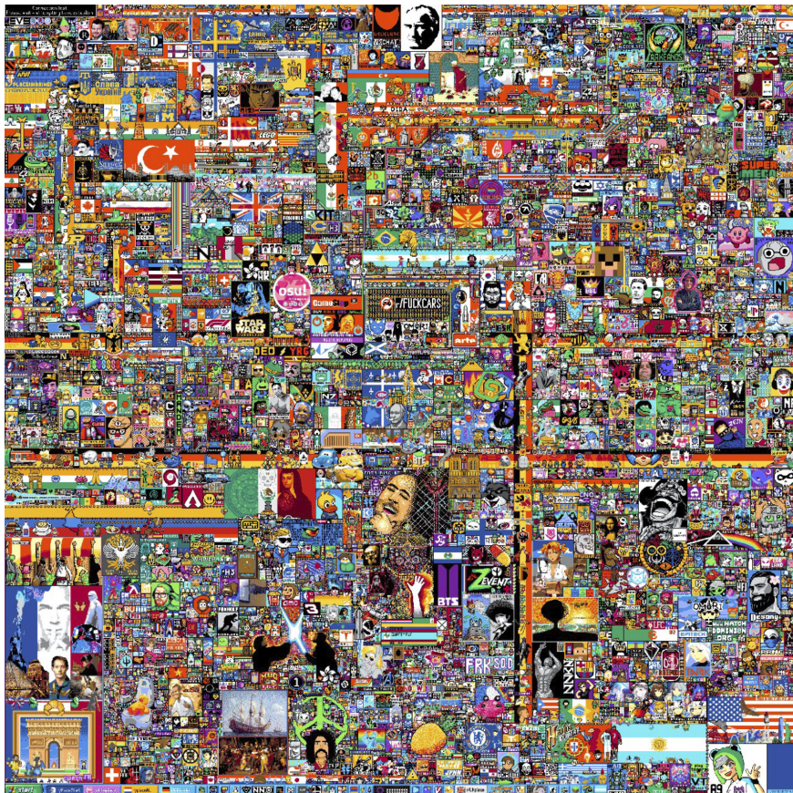
Figura 2. Captura del lienzo de Reddit Place analizada